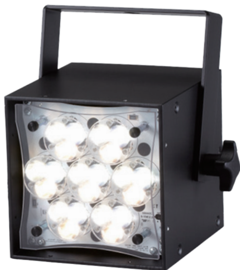
- WNC -