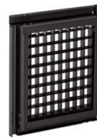
BRAQCUBE® エッグクレートルーバー