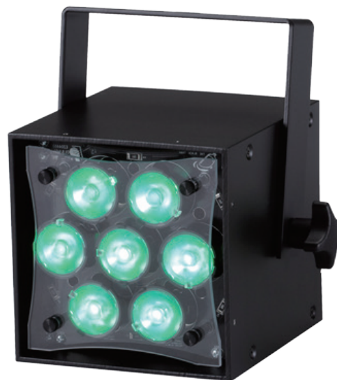
- 4C -

LED : 21×4W Cree XM-L LEDs 出力 : 7100ルーメン(レンズ無) 色温度 : 2700K-6500K